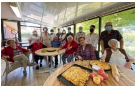
7 octobre 2021, le Secret de la Tarte d'Automne dévoilé par les résidents de La Ricandelle.

2021 fut une année résolument tournée vers la santé. La Municipalité en partenariat avec le CCAS ont réalisé des campagnes de prévention dans le cadre de Mars bleu, du Mois sans tabac, de la Semaine bleue qui fut ponctuée de nombreuses actions parmi lesquelles : collecte de dessins pour les Aînés, ateliers de sensibilisation, quizz intergénérationnel ou encore recettes de cuisine diffusées en direct de la Ricandelle.