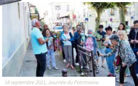
18 septembre 2021, Journée du Patrimoine.