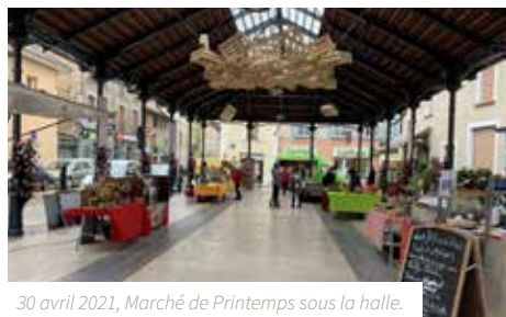
30 avril 2021, Marché de Printemps sous la halle.

Nous avons par ailleurs reconduit la gratuité et la possibilité d'extension des terrasses.