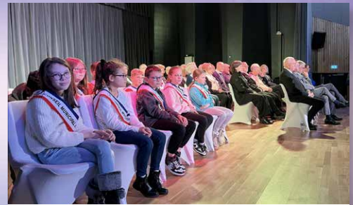
10/01/26 Cérémonie des vœux du Maire à la salle des spectacles.