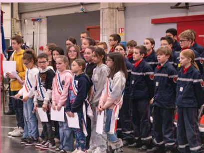
17/01/26 Sainte-Barbe des pompiers au cours de laquelle les jeunes élus ont reçu leur diplôme de formation aux premiers secours.