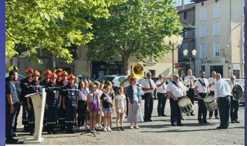
18/06/25 Commémoration de l'Appel historique lancé par le Général de Gaulle le 18 juin 1940. Le CMJ et les JSP ont chanté la Marseillaise.